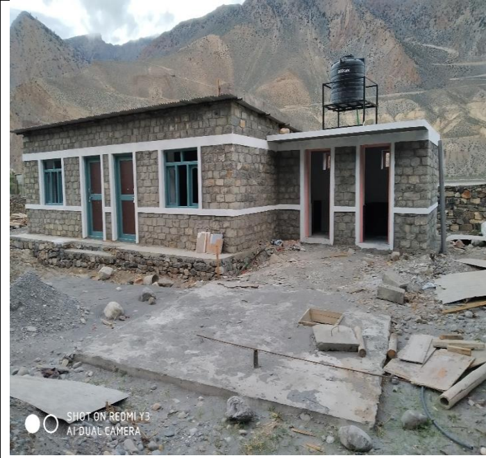
चौकिदार कोठा, भण्डारण कक्ष तथा शौचालय