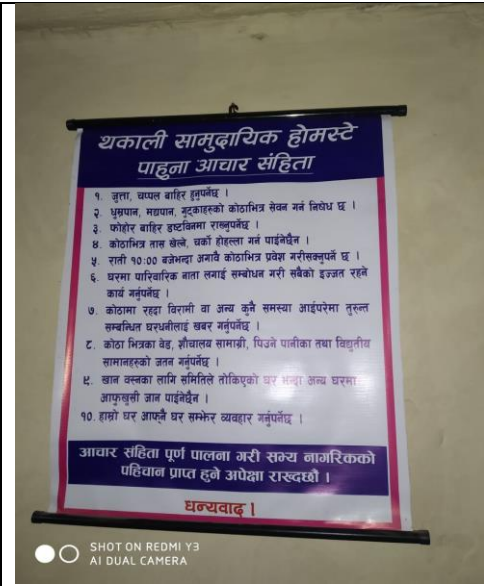
पाहुना आचार संहिता