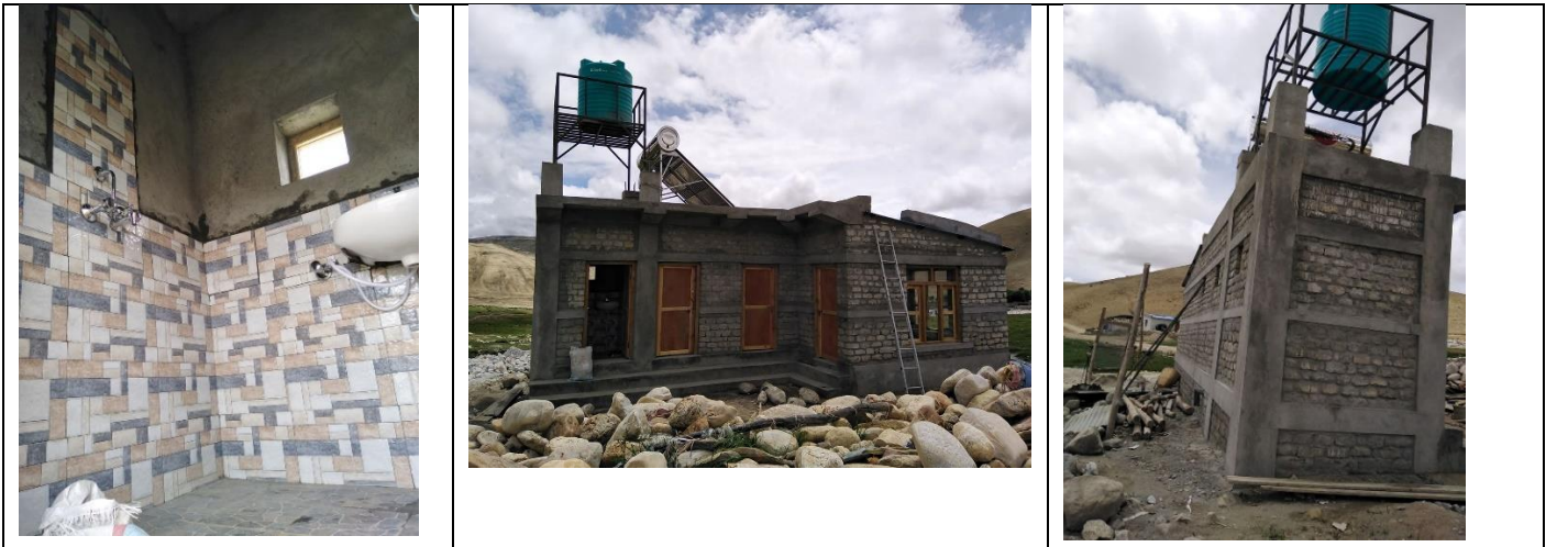
सामुदायिक होमस्टे, चुडजुड को निर्मित स्नान गृह, शौचालयको अवस्था

आ.व. २०७५/०७६ मा उ.प.व तथा वातावरण मन्त्रालयको रु १० लाखको पुँजीगत अनुदान तथा गाउँपालिका एवं स्थानियको रु ५ लाख ७० हजार गरि कुल १५ लाख ७० हजारमा होमस्टे पुर्वाधार कार्यक्रम अन्तर्गत सामुदायिक स्नान गृह निर्माण कार्य सम्पन्न भएको छ ।