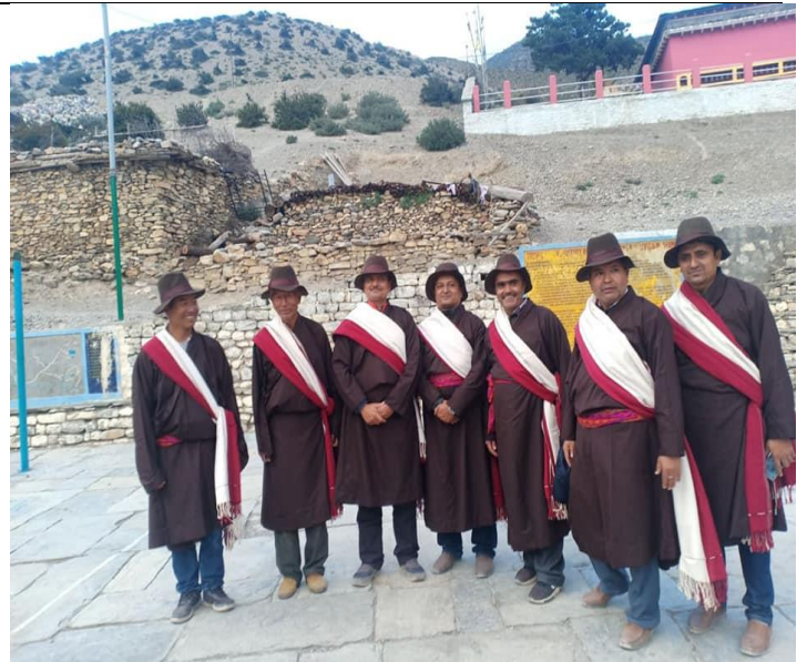
थकाली संस्कृती तथा भेषभुषा