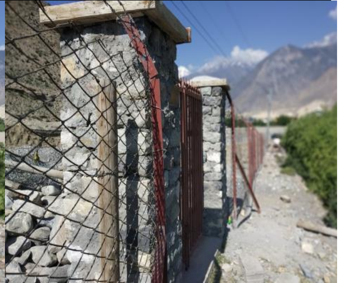
तारवार तथा गेट