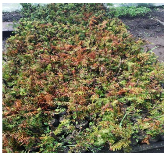
ग्रिन हाउस भित्र लौठ सल्लाको कटिड विरुवा